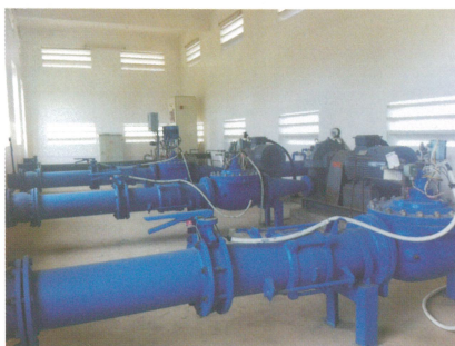
65,000 m 3 /天 淨化水和原水供應