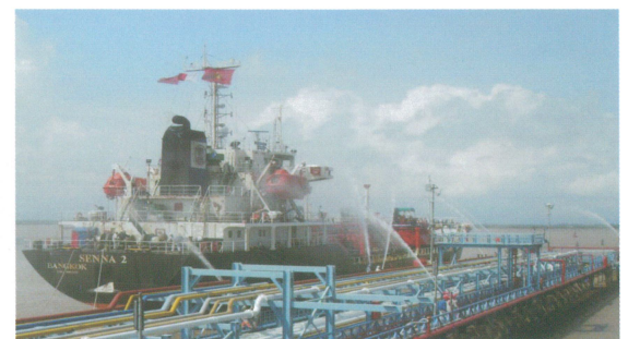
全自動的消防系統