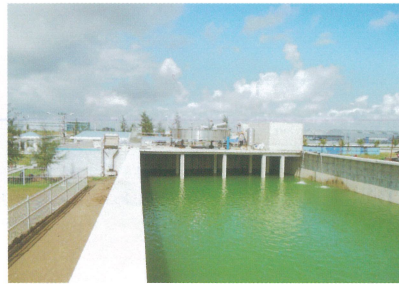
24,000m 3 /天 污水處理能力 (ISO 9001/14001)