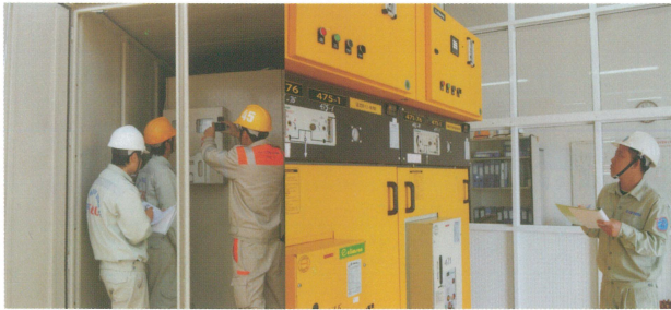
220/110/22kV – 500MVA完備的地下配電設備